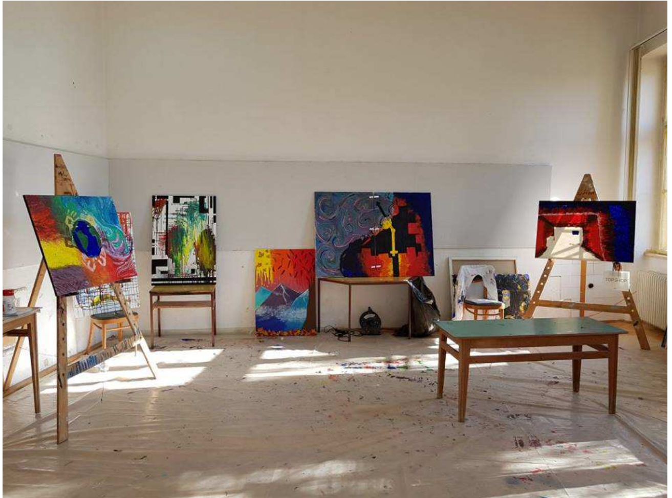
Ema Žoldoš in Kaja Škrban, 1. a

Izredno se veselim in pričakujem naslednjo likovno kolonijo, ki naj bi naslednje leto bila nekje drugje. Upam, da se bom ponovno lahko veliko naučila o umetnosti in srečala vsaj nekatere od teh deklet, s katerimi sem preživela čudovite tri dni.